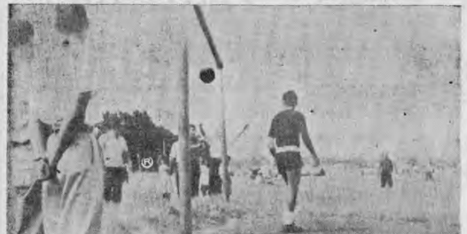
Esta fue la puntilla para el cuadro alajuelense. Un tiro libre cobrado a la perfección por el conjunto de la República.