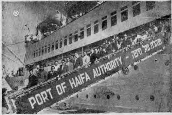
El grupo de becados latinoamericanos en el Curso de Adiestramiento de Guías Juveniles, desembarcando del SS ISRAEL, a su llegada al Puerto de Haifa, el 21 de octubre.