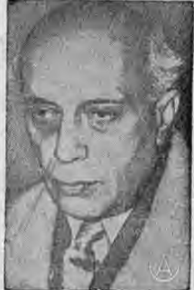
NEHRU ...un angustioso llamado al mundo libre...

WASHINGTON, 19.—(AP).— India pidió hoy al Presidente John F. Kennedy más ayuda militar de los Estados Unidos en vista de lo que ha sido descrito como una situación militar de fensiva pésima.