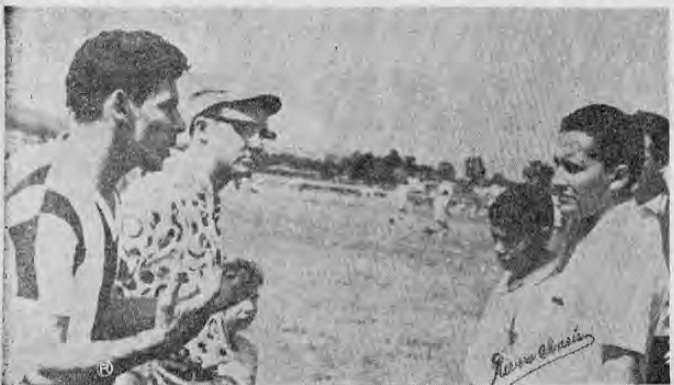
Había preocupación en el alto mundo del equipo LA REPUBLICA, pues el primer tiempo había terminado con un empate. Varios cambios acordados en posiciones que se estudiaron detenidamente fue el factor principal para que los muchachos de